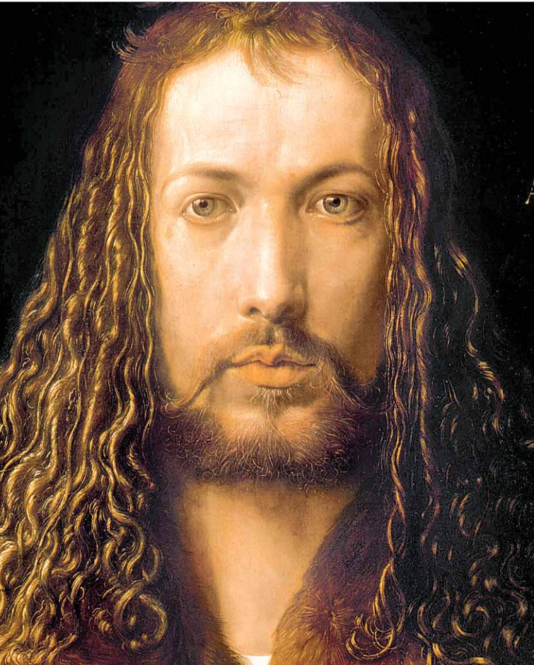
Selbstbildnis im Pelzrock, 1500, ALBRECHT DÜRER

Abbildungen (von oben nach unten): Hieronymus Bosch »Die Kreuztragung Christi«, 1515/16; Museum voor Schone Kunsten, Gent; Foto: Paul M.R. Maeyaert/AGK Berlin; Meister von Flémalle »Die heilige Veronica«, um 1410; Städtisches Kulturinstitut, Frankfurt; Foto: Ursula Edelmann/www.artothek.de; El Greco »St Veronica with the Holy Shroud«, 1577/78; Museo de Santa Cruz, Toledo; Foto: The Bridgeman Art Library; Albrecht Dürer »Selbstbildnis im Pelzrock«, 1500; Alte Pinakothek, München; Foto: AGK Berlin