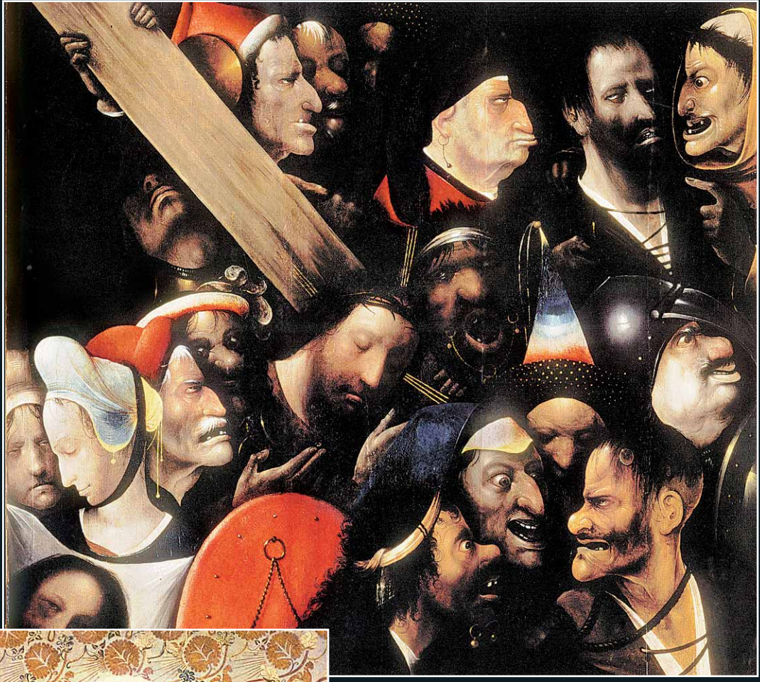
Die Kreuztragung Christi, HIERONYMUS BOSCH, 1515/16

Diese Erzählung kann man auch andersherum lesen: Sie ist sekundär, nachträglich. Nicht sie war als Erstes da, sondern das Bild. Es war in